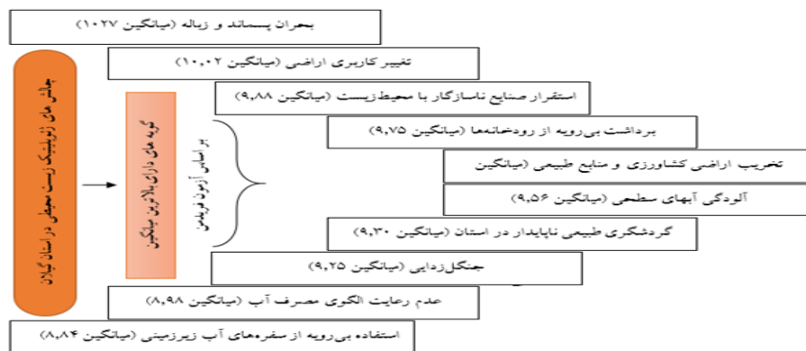
شکل ۱- رتبه‌بندی گویه‌های پرسشنامه و تبیین گویه‌های دارای بالاترین میانگین

بررسی داده‌های گردآوری شده نشان می‌دهد به طور میانگین بیش از ۶۰ درصد از پاسخگویان میزان تأثیرگذاری مجموع گویه‌ها را -در یک نگاه کلی- بر تشدید پیامدهای اقتصادی-اجتماعی ناشی از بحران آب در استان گیلان در سطحی بالا (بسیار زیاد) می‌دانند. همچنین در جدول فوق علاوه بر تشریح نظرات پاسخگویان پیرامون گویه‌های پرسشنامه، رتبه‌بندی این پرسشنامه با بهره‌گیری از آزمون فریدمن و استخراج میانگین هر یک از گویه‌ها نشان داده شده است. نتایج حاصل از رتبه‌بندی گویه‌ها نشان می‌دهد به ترتیب چالش‌هایی همچون بحران پسماند و زباله (میانگین ۱۰۲۷)، تغییر کاربری اراضی (میانگین ۱۰۰۲)، استقرار صنایع ناسازگار با محیط زیست (میانگین ۹۸۸)، برداشت بی‌رویه از رودخانه‌ها (میانگین ۹۷۵)، تخریب اراضی کشاورزی و منابع طبیعی (میانگین ۹۵۶)، آلودگی آب‌های سطحی (میانگین ۹۵۶)، گردشگری طبیعی ناپایدار در استان (میانگین ۹۳۰)، جنگل‌زدایی (میانگین ۹۲۵)، عدم رعایت الگوی مصرف آب (میانگین ۸۹۸) و استفاده بی‌رویه از سفره‌های آب زیرزمینی (میانگین ۸۸۴) اولویت‌های جامعه آماری را تشکیل داده و بیش از سایر گویه‌ها منجر به تشدید پیامدهای اقتصادی-اجتماعی ناشی از بحران آب در استان گیلان می‌شوند.