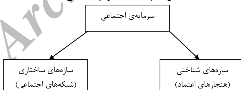
شکل ۲- ابعاد مختلف سرمایه اجتماعی

از بندهای بالا به چهاربند؛ «مشارکت در اجتماع محلی، پیوندهای همسایگی، پیوندهای خانوادگی و پیوندهای کاری» (اختری محقی، ۱۳۸۵) به سازه‌های ساختاری سرمایه اجتماعی یعنی «شبکه‌ی روابط اجتماعی» وابسته اند و چهار بند دیگر، «عملگرایی در یک بافت اجتماعی، احساس اعتماد و امنیت، ظرفیت پذیرش تفاوت‌ها و بها دادن به زندگی»، ابعاد شناختی سرمایه‌ی اجتماعی یعنی «هنجارهای اعتماد» هستند (شکل شماره ۲).