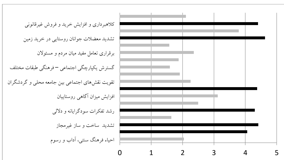
شکل ۳- میزان تاثیرات گردشگری در روستاهای مورد مطالعه (منبع: نویسندگان، ۱۳۹۸)