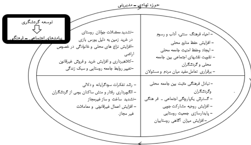
شکل ۱- مدل مفهومی پژوهش