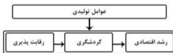
شکل ۱- روابط بین رقابت پذیری، گردشگری و رشد در مطالعات قبلی

همچنین می‌توان گفت که بررسی اثرات گردشگری بر رشد اقتصادی متأثر از سایر متغیرهای ضروری برای تبیین رشد از جمله سرمایه فیزیکی و انسانی و زیرساخت است. بنابراین، اگر آنها را برای توضیح رشد لحاظ نکنند، مطالعه مغرضانه خواهد بود. شکل ۱ روابط بین رقابت پذیری، گردشگری و رشد را نشان می‌دهد، جایی که رقابت پذیری به گردشگری بستگی دارد، گردشگری رشد ایجاد می‌کند و رشد به عوامل تولیدی بستگی دارد که بر رقابت پذیری گردشگری تأثیر می‌گذارد.